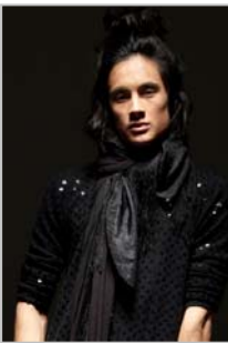
FRANCIS – UK

http://casting.benetton.com/users/257250-elizabeth