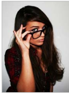
NATALCHOU - Kazakhstan

http://casting.benetton.com/users/657-melanie-alexander