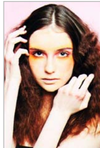
PRAGUEGIRL - Czech Republic

http://casting.benetton.com/users/161498-plastic-is-fantastic