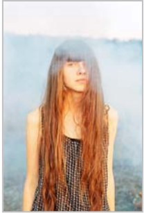
OLDYORK - Ukraine

http://casting.benetton.com/users/9333-natalchou