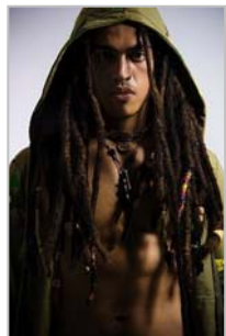
KIKO - Philippines

http://casting.benetton.com/users/1085-kevin