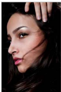
SHIRIN - Iran

http://casting.benetton.com/users/8157-sarah-d